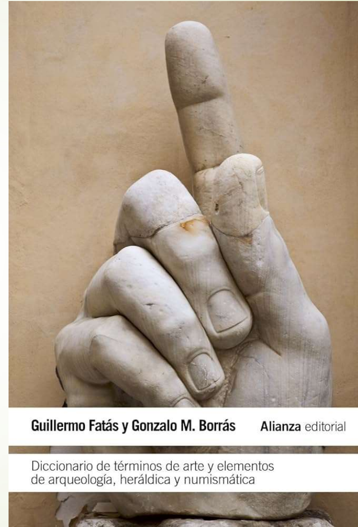
Diccionario de términos de arte (2012) Guillermo Fatás y Gonzalo Borrás Alianza Editorial